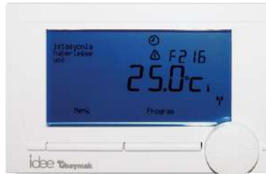
Baymak idee Programlanabilir Kablosuz (RF) Oda Termostatı (16900403)