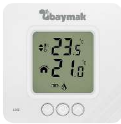
Logi Oda Termostatı (100021978)