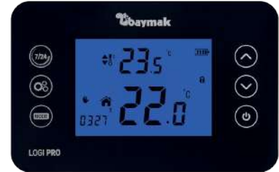
Baymak Logi Pro Kablosuz Programlanabilir Oda Termostatı (100022440)